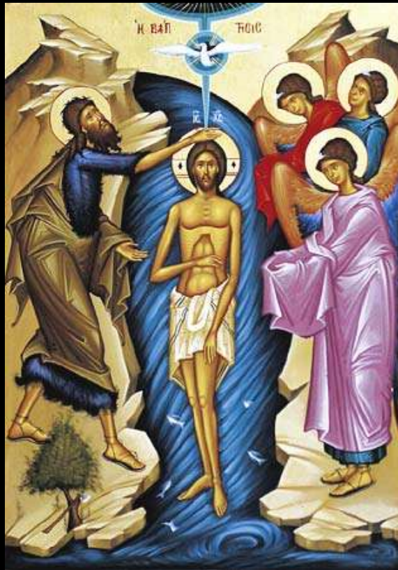
イエスの洗礼 Jesus' Baptism (1月13日 Jan 13)