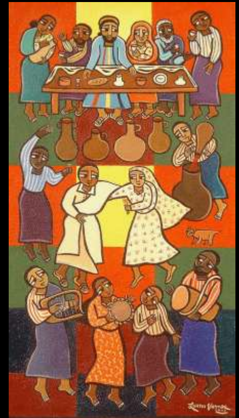
イエスの最初の奇跡 Jesus' First Miracle (1月20日 Jan 20)