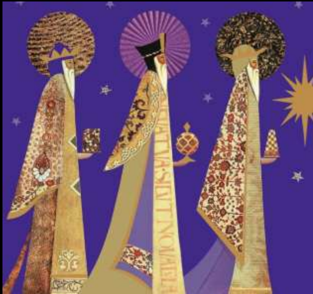
博士たち Wise Men (1月6日 Jan 6)